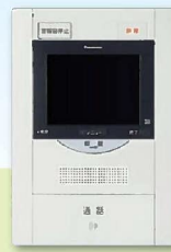
インターホン(親機)