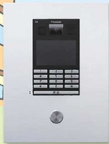
ロビーインターホン